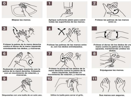
Ilustración se encuentra en cada estación de Lavado de Manos y Baños

⌚ Duración del lavado: entre 40 y 60 segundos